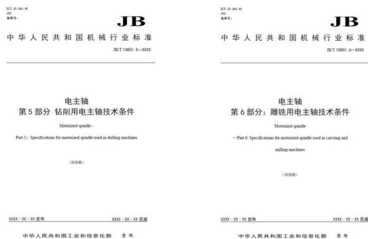
图5 参与起草的标准