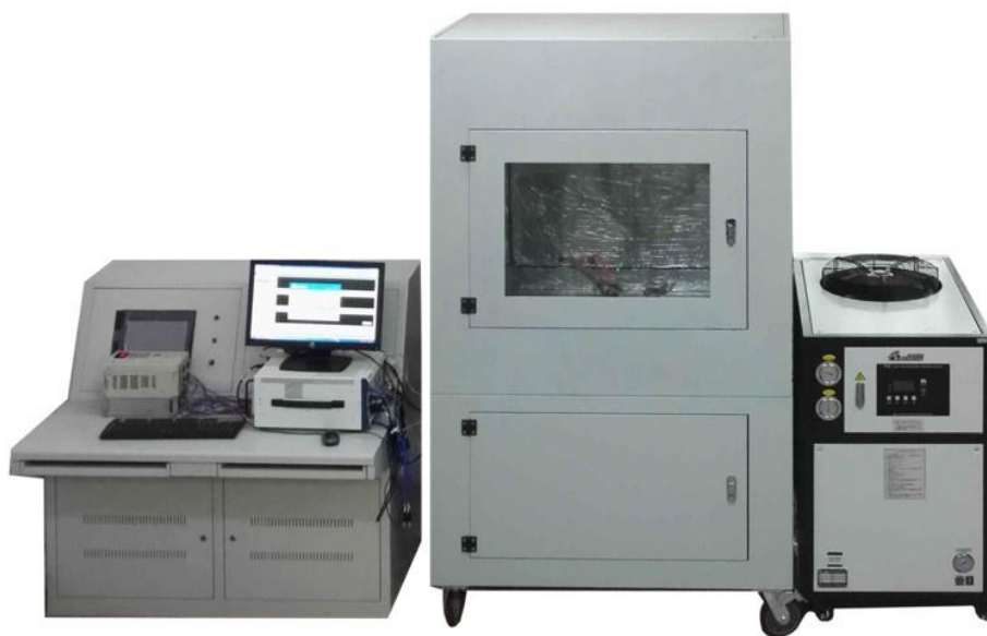
图3 自主研发的可靠性测试专用设备

得到电主轴最主要的故障原因是外购外协（41.18%），其次是装配（27.06%）。同时，通过实验，自主开发了一套电主轴可靠性测试专用设备。